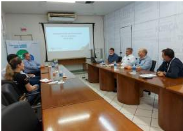
Apresentação do OSB- Chapecó no SICOM- Chapecó 23/02/2022