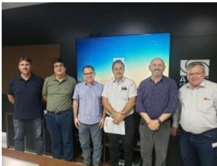
Apresentação do OSB- Chapecó na ACIC- Chapecó 10/03/2022