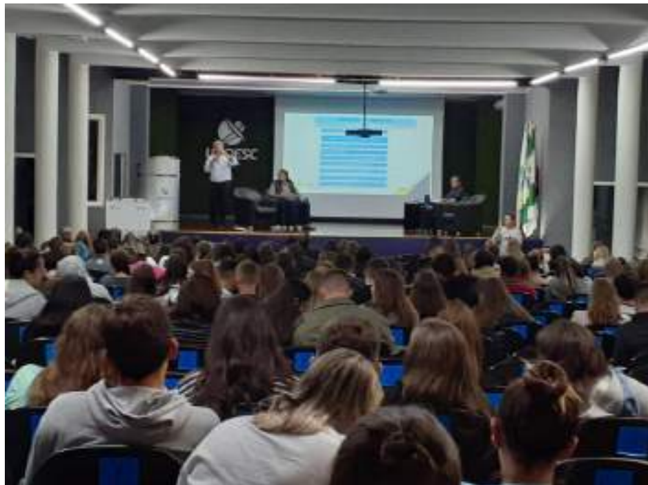
Apresentação do OSB-Chapecó na UNOESC 04/04/2022