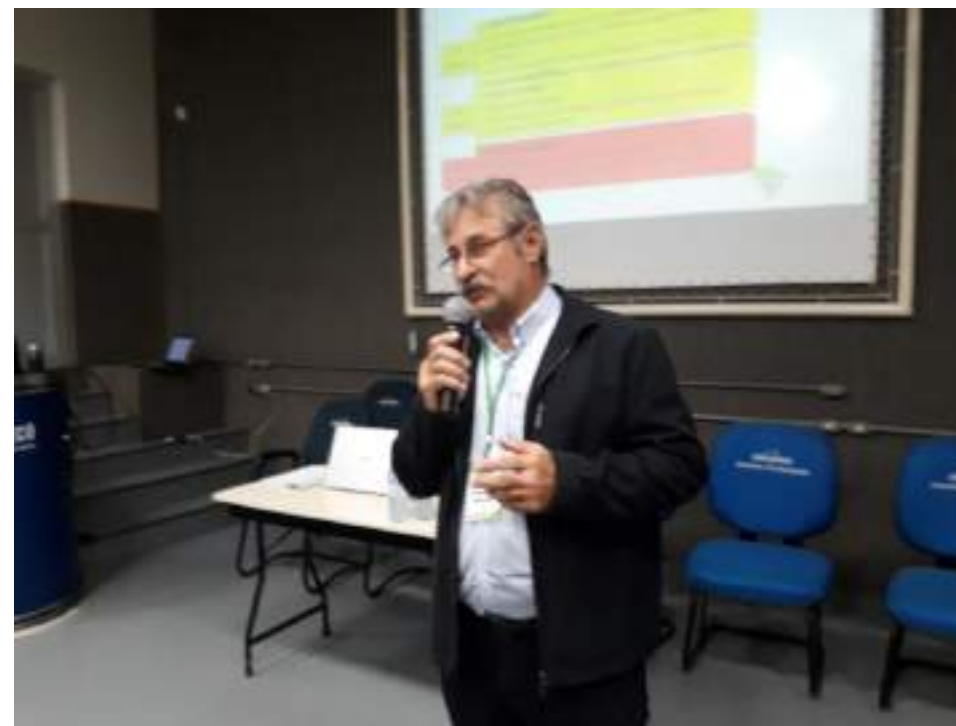
Apresentação do OSB-Chapecó na UNOCHAPECÓ 23/04/2022