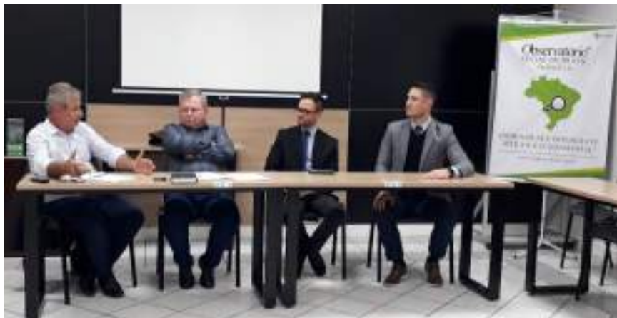
Reunião Especial com 10ª Promotoria e 5ª DECOR 12/05/2022